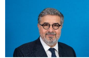
علي حسن خليل الرئيس التنفيذي